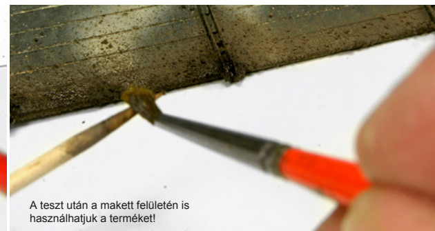
A teszt után a makett felületén is használhatjuk a terméket!

Használat előtt érdemes egy darab papíron kipróbálni a terméket.