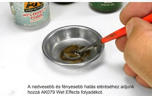
A nedvesebb és fényesebb hatás eléréséhez adjunk hozzá AK079 Wet Effects folyadékot.