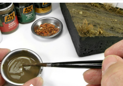
Keverjük össze AK016 Friss sár és AK078 nedves föld effektet egy kis gipszel, hogy felületi érdességet is adjunk a területnek.