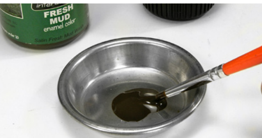
Egy keveset helyez a termékből egy tálkára.