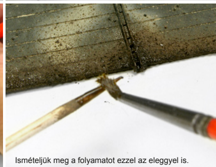
Ismételjük meg a folyamatot ezzel az eleggyel is.